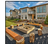
Penkkin lopulliset sijoitukset määrätään maastossa (20 kpl)