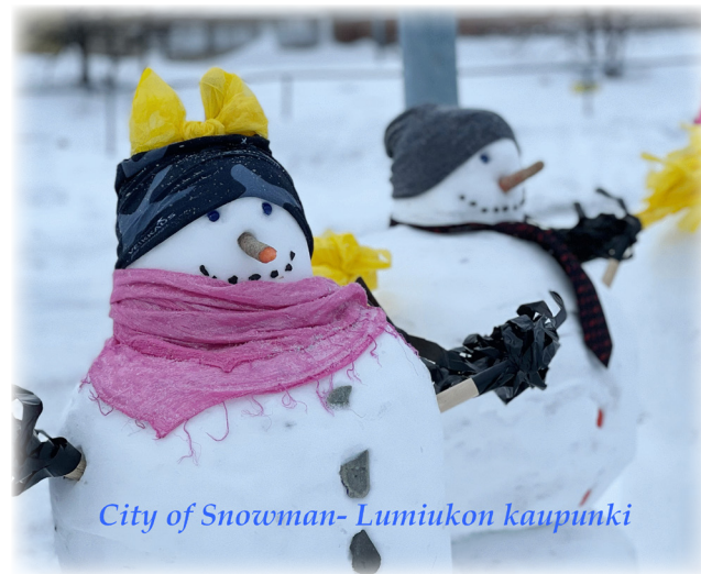
City of Snowman- Lumiukon kaupunki